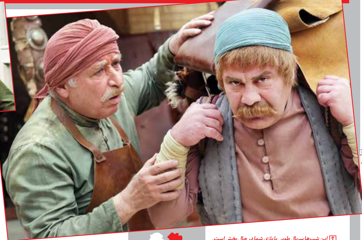
نمایی از سریال «مهیبار عیار»

در حال بازی در کار عروسکی «معجون عروسک» به کارگردانی محمد حدادنسب و تهیه‌کنندگی امین رضی هستم. معجون عروسک یک مینی‌سریال فانتزی و کمدی در حوزه کودک است. در فیلم موزیکال «هر چی تو بگی» هم حضور داشتم که تصویربرداری آن در اصفهان به پایان رسیده است. سریال تانک‌خورها هم آماده پخش است که بعد از سریال غریبه روی آنتن شبکه سه می‌رود. این سریال کار آقای پرویز شیخ‌طادی است که به افراد گمنام در جنگ می‌پردازد و اتفاقات کمتر شنیده‌شده را روایت می‌کند.