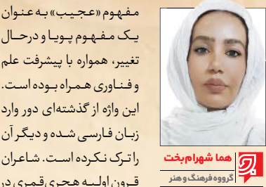
هما شورام‌بخت آرکوه فرهنگ و هنر

قزوینی در بخش‌هایی از کتاب خود به پیشه توصیف پدیده‌ها ، موجودات شگفت‌انگیز و نادر جهان اشتغال ورزیده، موجودات افسانه‌ای، وقایع طبیعی و غیرمعمول و شگفتی‌های جغرافیایی و طبیعی را به تصویر کشیده است. او در بخش جانورشناسی از صید ماهی‌ای سخن می‌گوید «به غایت بزرگ و او را به رسن‌ها و قلاب‌ها به ساحل کشیدند و از گوش او کبیرکی بیرون آمد خوب‌صورت و سرخ و سفید که موهای دراز داشت....» سیمرغ با عنفا بخش دیگری از این کتاب است. به باور قزوینی، این حیوان بسیار بیش از آفرینش آدم ابوالبشر بدون تولید مثل زندگی کرده، نخستین و قدرتمندترین پرنده بوده است و از آنجایی که پرنده‌ای خردمند محسوب می‌شود، هشدارها و نصایح اخلاقی می‌دهد. به باور او، سیمرغ در زمان سلیمان (ع) نیز حضور داشته و مورد احترام وی بوده است. او در این کتاب از هما یاد می‌کند که اگر بر سر کسی بنشیند، به پادشاهی می‌رسد و سمندر را نام می‌برد که «پرنده‌ای آتشین» است و از زمان حضرت محمد (ص) دیده نشده است. سپس از غول می‌گوید که «کسی که سفر کند تنها در بیابان‌ها به شب معترض او شود و خواهد که او را از راه بیفکند....» و به نقل از کسانی که غول را دیده‌اند، او را سرتا پا بر شکل انسان و از ناف تا آخر بر شکل اسب» است.