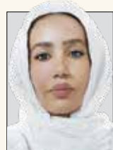
هما شورا، محبت گروه فرهنگ و هنر

چرا که فلسفه و حکمت ارتباط تنگاتنگی با یکدیگر دارد.